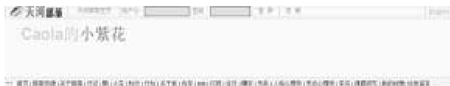
图1 Blog“Caola的小紫花”栏目截图

第一步,申请属于自己Blog空间。在图1的最上端处点击“注册”按钮,打开一个注册页面,填写相应的信息,点击“提交”完成注册。这样就拥有了一个属于自己的Blog。在其他Blog平台上申请,比如中国教育人博客、blogbus、bokee、blogcn等,过程也是如此。